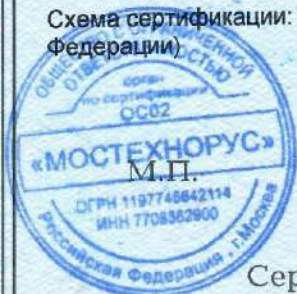
Схема сертификации: 1с (ГОСТ Р 53603-2020 Оценка соответствия. Схемы сертификации продукции в Российской Федерации)