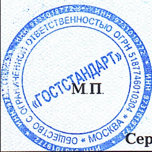
Схема сертификации: 1с.