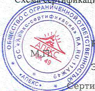
Схема сертификации: Зс.