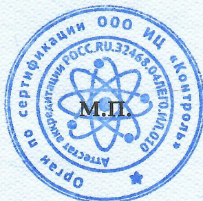
СХЕМА СЕРТИФИКАЦИИ 1с (ГОСТ Р 53603-2020. Оценка соответствия. Схемы сертификации продукции в Российской Федерации).